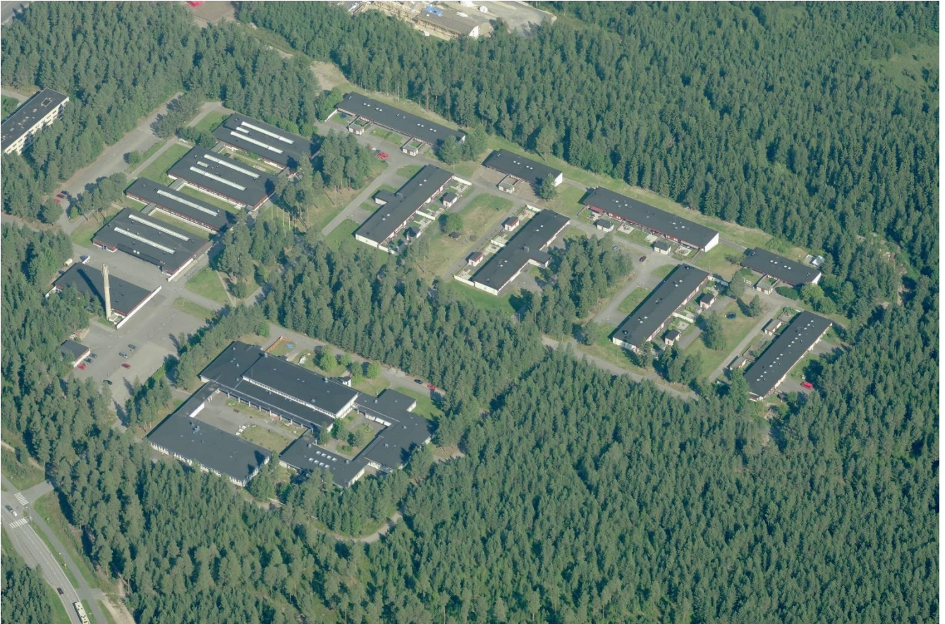
Ilmakuva alueelta 2012.

Yhdyskunta- ja ympäristöpalvelut, kaavoitus (käyntiosoite: Solistinkatu 2, Oulu) kaavoitusarkkitehti Jere Klami, p. 044 703 2412, etunimi.sukunimi(at)ouka.fi suunnitteluavustaja Irma Hyry, p. 044 703 2426, etunimi.sukunimi(at)ouka.fi kaavoituksen asiakaspalvelu, p. 050-3166 850, 050-3166 849